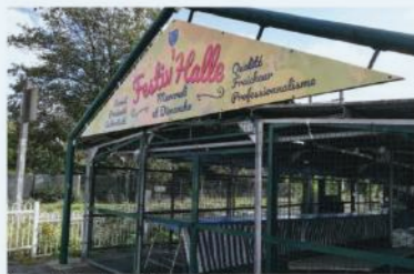
Un nom a été donné au marché, courant octobre.

Le renforcement du marché s'inscrit dans une « volonté globale de dynamiser le centre de la commune ». Tout près de là, la rue de Paris et la rue du Marché sont depuis peu sonorisées, par exemple, pour