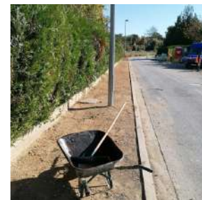
Réfection des trottoirs rue des Voyeux