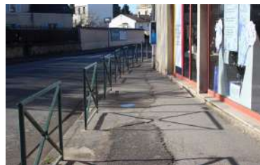
Barrières de sécurité sur le trottoir jouxtant la pharmacie et l'opticien